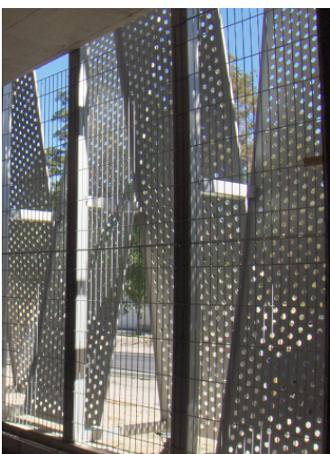
Näkymä sisältä ulos