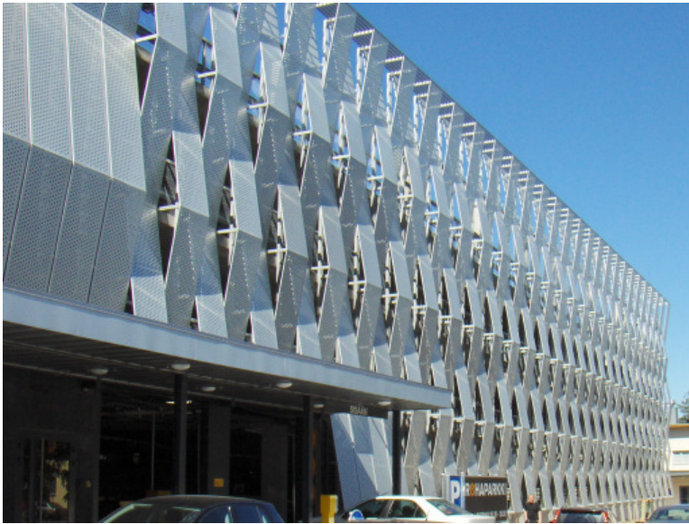
Itäsivu ( länsisivu vastaavanlainen)